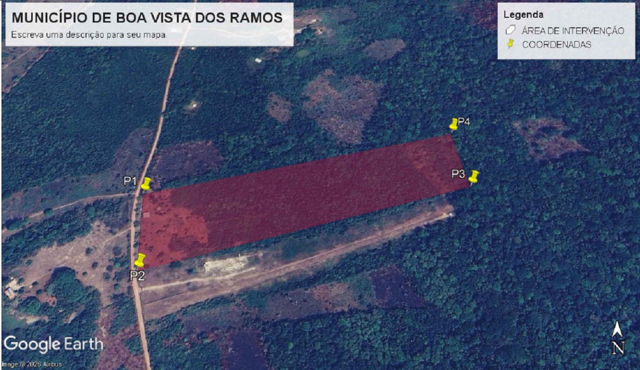
IMAGEM MACRO DE SATÉLITE - SITUAÇÃO SEM ESCALA