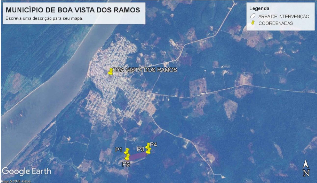
IMAGEM MICRO DE SATÉLITE - SITUAÇÃO SEM ESCALA

OS DADOS CONTIDOS NO PROJETO VIGENTE SÃO PROVENIENTES DOS LEVANTAMENTOS FEITOS IN LOCO PELA PREFEITURA DE BOA VISTA DO RAMOS. CONSEQUENTEMENTE AS ESCOLHA DOS BENEFICIARIOS QUE SERÃO E NÃO SERÃO CONTEMPLADOS É DE RESPONSABILIDADE DA PREFEITURA DO MUNICIPIO CITADO. E COM BASE NOS PARAMETROS DE CADA BENEFICIARIO, A MESMA DETERMINA A LISTA EFETIVA PARA A IMPLANTAÇÃO DO PROJETO CONTIDO NESTE CONVENIO.